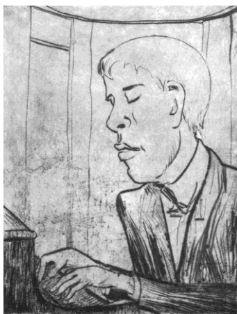
Erich Heckel: Pianist [Eduard Erdmann] (Radierung, 1924)

Berg hatte sich bereits 1919 für Erdmanns Aufführung seiner Klaviersonate op. 1 freundlich bedankt. Er regte auch die Aufnahme von Kompositionen Erdmanns in das Verlagsprogramm der Universal Edition an, wo ab 1924 mehrere Werke erschienen. 1921 erfolgte in Berlin die Uraufführung von Erdmanns Rondo op. 9 durch die Berliner Philharmoniker unter Leitung ihres Chefdirigenten Arthur Nikisch und 1924 in Bochum die Uraufführung der Ernst Křenek gewidmeten 2. Symphonie unter Rudolf Schulz-Dornburg, der sie im gleichen Jahr auch in Prag auf dem Festival der ISCM dirigierte. 1925 hörte man die 1. Symphonie unter dem Dirigat Peter Raabes in Berlin. Alfred Einstein verstieg sich sogar zu der Äußerung, dass Erdmann zu dem fortschrittlich gesinnten Kreis der Křenek, Jarnach und Hindemith gehöre, den er an stürmischem Temperament noch übertreffe. In der Tat waren Werke Erdmanns auf Internationalen Musikfesten zu hören: in Salzburg (1923), Prag (1924) und Wien (1932). Erdmann ließ sich auch von der unterhaltenden Musik der Goldenen Zwanziger Jahre in Berlin mitreißen; er schätzte Friedrich Hollaender und Leo Fall, lernte bei Heinz Tiessen den später berühmt gewordenen Filmkomponisten Richard Heymann kennen, interessierte sich für George Gershwin und den Jazz und ließ sich zu eigenen Kompositionen inspirieren dem Dollarlied (1921), dem FOX TROT (1923), der Operette Die entsprungene Insel (1925–1927).