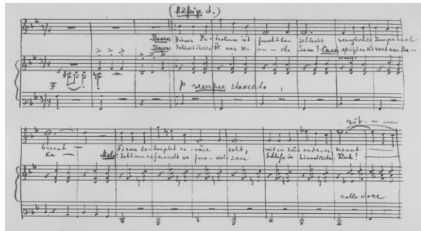
Petroleumquintett (Bleistiftskizze zu Nr. 5 der Operette Die entsprungene Insel , 1925)

Dieses Petroleum ist furchtbar schlecht, wenngleich die Lampe auch brennt, Firma behauptet es wäre echt, weil sie kein anderes kennt.