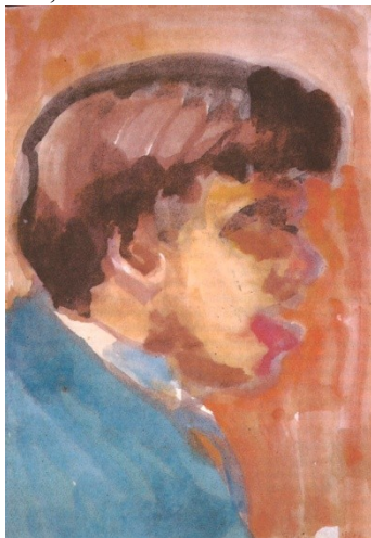
Emil Nolde: Eduard Erdmann [singend] (Aquarell, um 1930)

1921 wurde Erdmann gemeinsam mit Joseph Haas in die Jury des Ersten Kammermusikfestes in Donaueschingen berufen. Er traf mit Paul Hindemith, Philipp Jarnach und Alois Hába zusammen, deren Werke aufgeführt wurden. Erdmann spielte dort die Sonate op. 1 von Alban Berg.