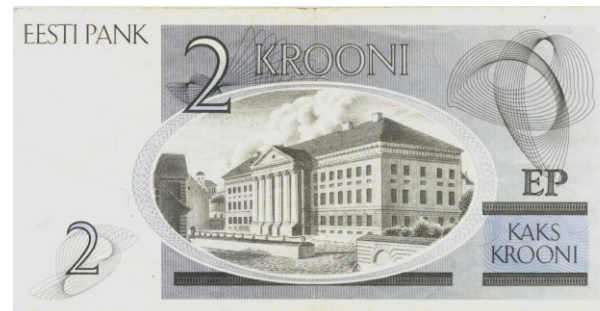
Universität Dorpat/Tartu, Estland

Die überragende Bedeutung des Karl Ernst von Baer hat die Republik Estland gewürdigt. Sein Porträt ist auf der seit 1992 gültigen Zwei-Kronen-Banknote abgebildet.